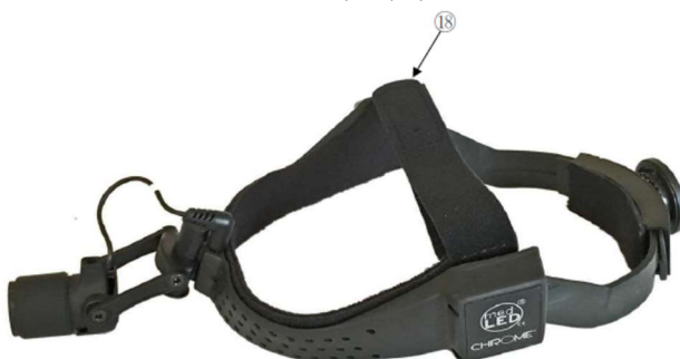
ソフトトップタイプ