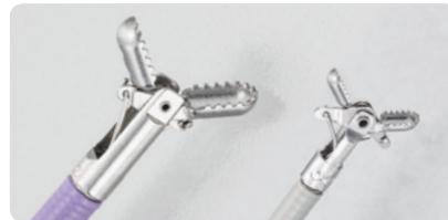
Baby GI ジョー